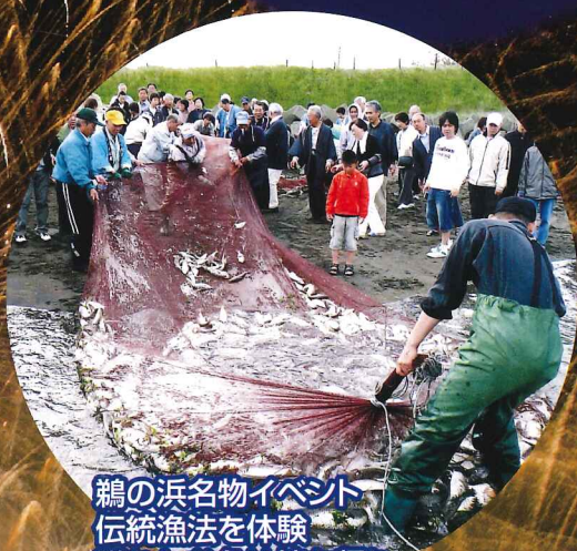
鵜の浜名物イベント 伝統漁法を体験 獲れたお魚は持ち帰り